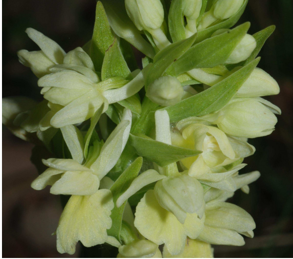
Dactylorhiza markusii (Tin.) H. Baumann & Kunkele

As orquídeas constituem um dos mais belos grupos de plantas e um dos maiores êxitos da evolução vegetal recente (20/30 milhões de anos). Apresentam estruturas morfológicas e anatómicas das mais especializadas do reino vegetal.