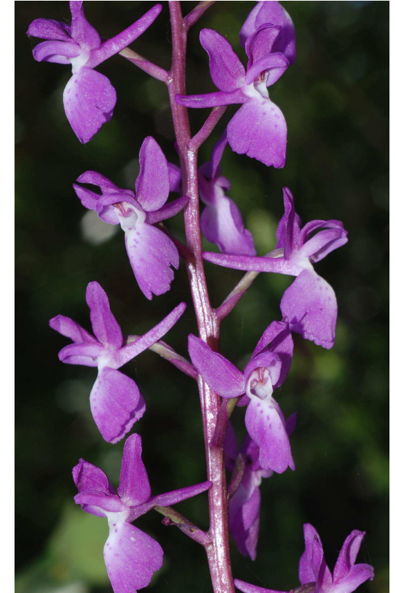
Orchis langei K.Richter

A família das orquídeas europeias, embora de flores menores, por isso, menos vistosas que as tropicais, não deixam de nos fascinarem, sobretudo quando as descobrimos durante um passeio pelo campo. Esta é composta por mais de duzentas espécies.