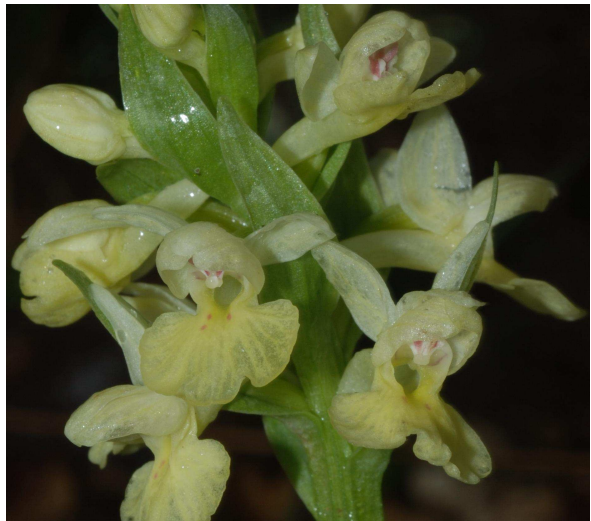
Dactylorhiza insularis (Sommier) Landwehr

As orquídeas constituem um dos mais belos grupos de plantas e um dos maiores êxitos da evolução vegetal recente (20/30 milhões de anos). Apresentam estruturas morfológicas e anatómicas das mais especializadas do reino vegetal.