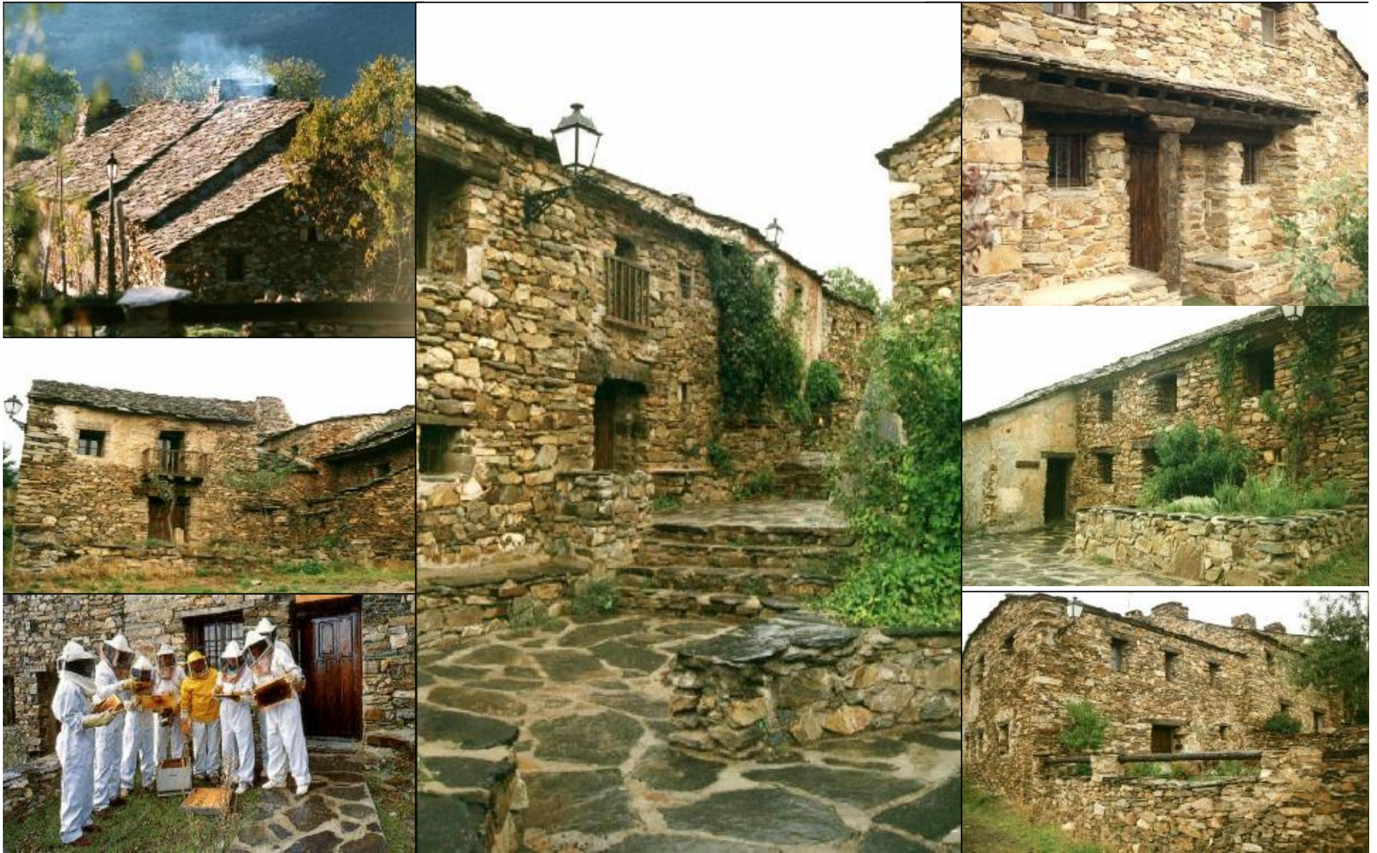
Arquitectura negra de la Sierra de Ayllón.