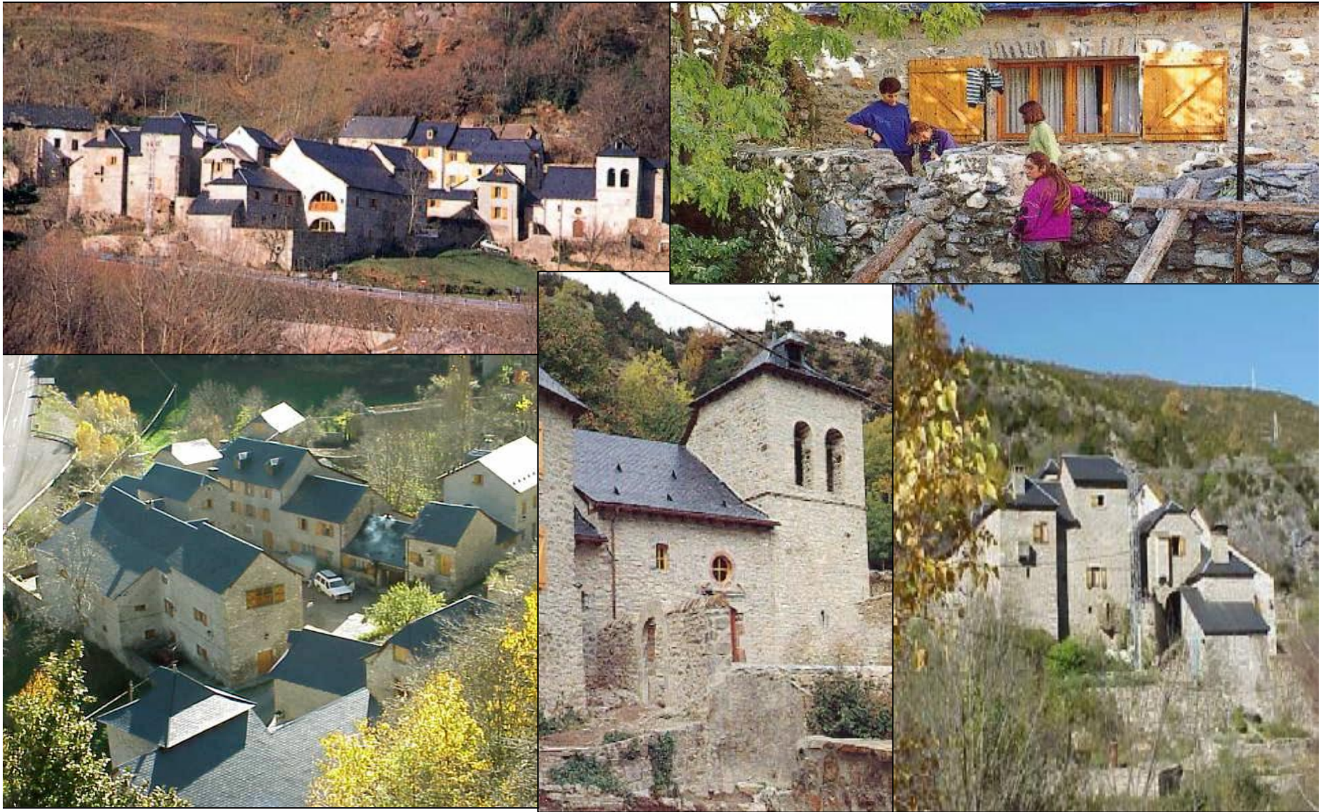
Pueblo de montaña en el Alto Pirineo.